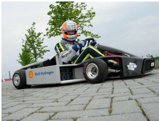
Formula Zero's Waterstof Race - Kart